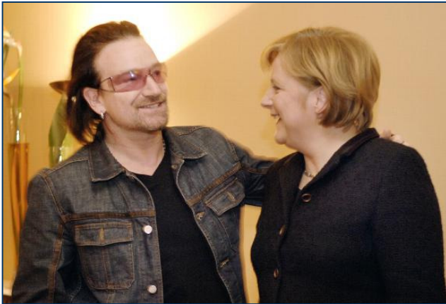
Bundeskanzlerin Angela Merkel mit Rocksänger Bono

Ein neuer Trend in der Entwicklungshilfe kommt seit einigen Jahren von erfolgreichen Konzernchefs wie Bill Gates, George Soros oder Warren Buffet, berühmten Persönlichkeiten wie Bono, dem Leadsänger der irischen Rockgruppe „U2“, Bob Geldof oder Madonna, Ex-Politikern wie Bill Clinton und Wirtschaftsprofessoren wie Jeffrey D. Sachs mit seinem Team aus über 250 Entwicklungsexperten. Allein die Bill & Melinda Gates Foundation gibt pro Jahr 1,5 Mrd. US Dollar für die Bekämpfung von Malaria, Tuberkulose und AIDS aus und damit etwa so viel, wie die Weltgesundheitsorganisation (WHO) als Jahresbudget zur Verfügung hat. 21