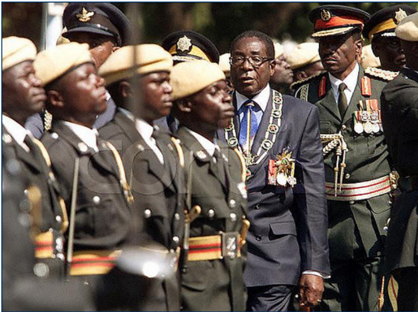
Robert Mugabe: Wie ein Diktator sein Land in den Ruin treibt

frühere kenianische Präsident Daniel arap Moi, der in seinen 24 Dienstjahren rund 3 Mrd. Dollar auf die Seite gebracht hat. 30