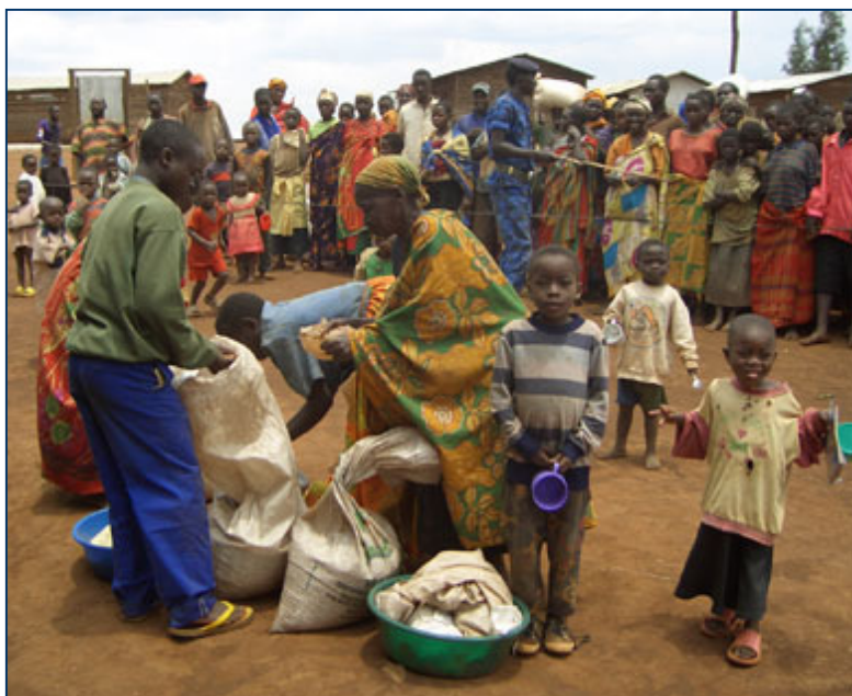
Entwicklungshilfe: Fluch oder Segen? Es kommt darauf an, wen man fragt.