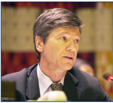
Mit seinen Theorien will Jeffrey Sachs binnen 20 Jahren die Armut abschaffen

Sein Modell der „Millenniums-dörfer“ basiert nicht auf einzelnen Technologien, sondern auf einer Kombination verschiedener entwicklungspolitischer Instrumente, die zu einem „Paket von Interventionen“ verpackt werden. Neben der Schaffung infrastruktureller Mindestanforderungen wie Straßenanbindung, Elektrizität und einer verlässlichen Trinkwasserversorgung werden allen Bewohnern eines Dorfes Moskitonetze zur Verfügung gestellt und Dünger verteilt, damit die Bauern eine höhere Ernte erzielen können. 23