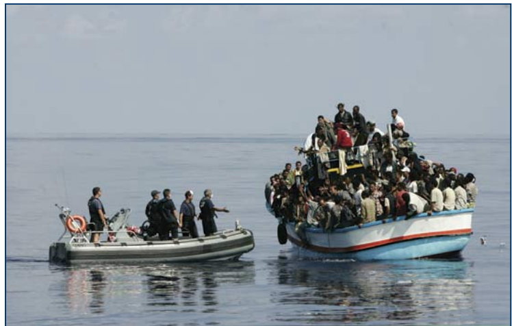
Afrikanische Flüchtlinge auf dem Weg nach Europa

Vor diesem Hintergrund ist es kaum verwunderlich, dass in Nouadhibou, im Norden Mauretaniens, viele Fischer ihre Pirogen lieber an die skrupellosen Menschenhändler verkaufen, die unzählige junge afrikanische Migranten unter oftmals katastrophalen Bedingungen und mörderischen Umständen illegal auf die Kanaren befördern. Während der Fischmarkt wegbricht, steigt die Nachfrage nach den kleinen Booten. Viele Fischer geben resigniert auf und verkaufen ihre Boote. "Fischer werden in Staaten wie Senegal, Mauretanien und Guinea selbst zu Flüchtlingen, weil sie ihre Arbeit verlieren", sagt Béatrice Gorez von der Coalition for Fair Fisheries Arrangements (CFFA). 16