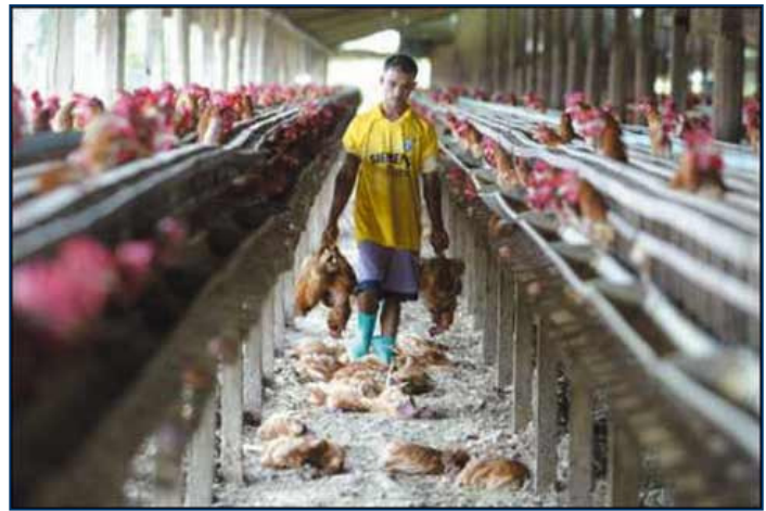
Hühnerdumping – alles, was dem Europäer nicht schmeckt, geht nach Afrika

Da die meisten Europäer nur noch Hühnerbrust bevorzugen und alle anderen Körperteile des Huhns verschmähen, mussten bislang Hühnerschenkel, Füße, Rücken und Innereien mit erheblichen Kosten zu Tiermehl verarbeitet werden. Nachdem dies aufgrund der BSE-Skandale untersagt wurde, suchte man nach neuen Ideen, den Hühnermüll noch möglichst gewinnbringend zu verschern. So begann der „große Exodus zerstückelter Hühner“ nach Kamerun, Togo, Ghana, Senegal, Angola und Liberia. Waren es zunächst 8.000 Tonnen, sind es heute bereits über 90.000 Tonnen Billigfleisch, die alljährlich auf den afrikanischen Märkten verschleudert werden. Mit einem Verkaufspreis von 65 Cent per Kilo erzielen die Europäer immer noch glänzende Gewinne. Die Verlierer sind einmal mehr die Afrikaner. In den genannten Ländern wurde mit den Billigimporten der lokale Hühnermarkt zerstört. Früher lebten in Ghana rund zwei Millionen Menschen von der heimischen Geflügelproduktion. Heute rentiert sich dieses Geschäft für sie nicht mehr. 19 Ein weiteres trauriges Beispiel, wie durch wirtschaftliche Interessen Europas Hunderttausende Afrikanern die Lebensgrundlage entzogen wird. Statt wirtschaftlicher Entwicklung - wirtschaftlicher Ruin!